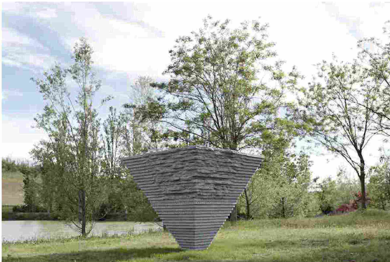
— Fondazione La Raia – A. Missika – Palazzo delle Api 2018

Domenica 27 maggio verrà presentata alla Fondazione La Raia l'opera permanente site specific Palazzo delle Api che l'artista francese Adrien Missika ha creato in risposta alle attività dell'azienda biodinamica e al paesaggio del territorio del Gavi. La curatela del progetto è di Ilaria Bonacossa .