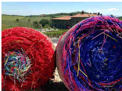
Michael Beutler Bales, 2014/2017 Colored Plastic Circa Ø 150 Cm X 120 Cm

Sabato 27 maggio, a partire dalle 11, a meno di due chilometri da Serravalle, Fondazione La Raia introdurrà il quinto intervento permanente installato nei campi, nei terreni, nelle vigne della sua tenuta.